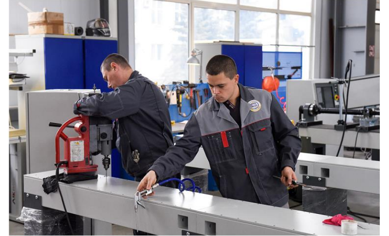
المجمع الانتاجي «العلم»