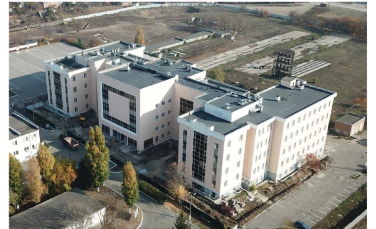
سكنات طلابية جديدة بنظام شقق منفصلة و قسم اجتماعي خاص ( بالخدمة منذ عام 2019 )